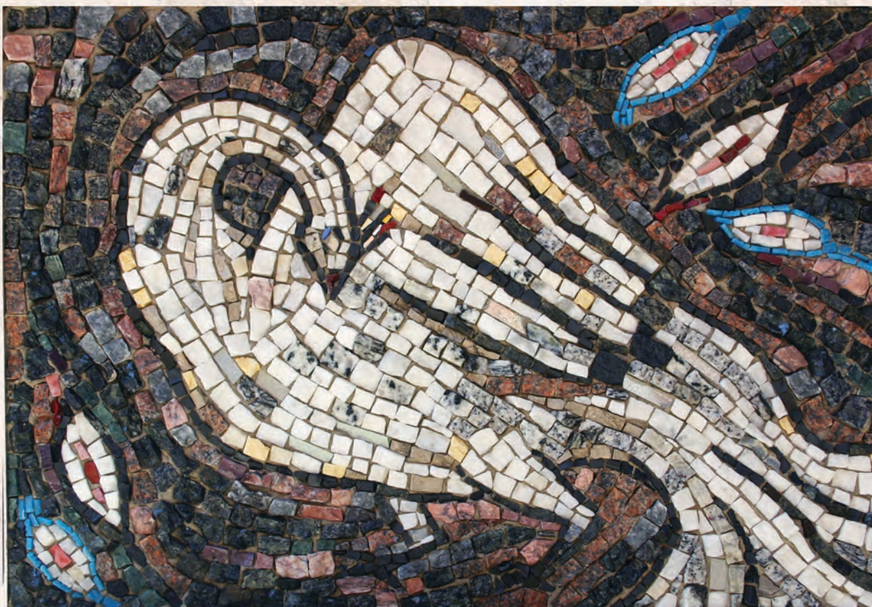
Мотив 1/7 2017. мозаик, 41x57cm