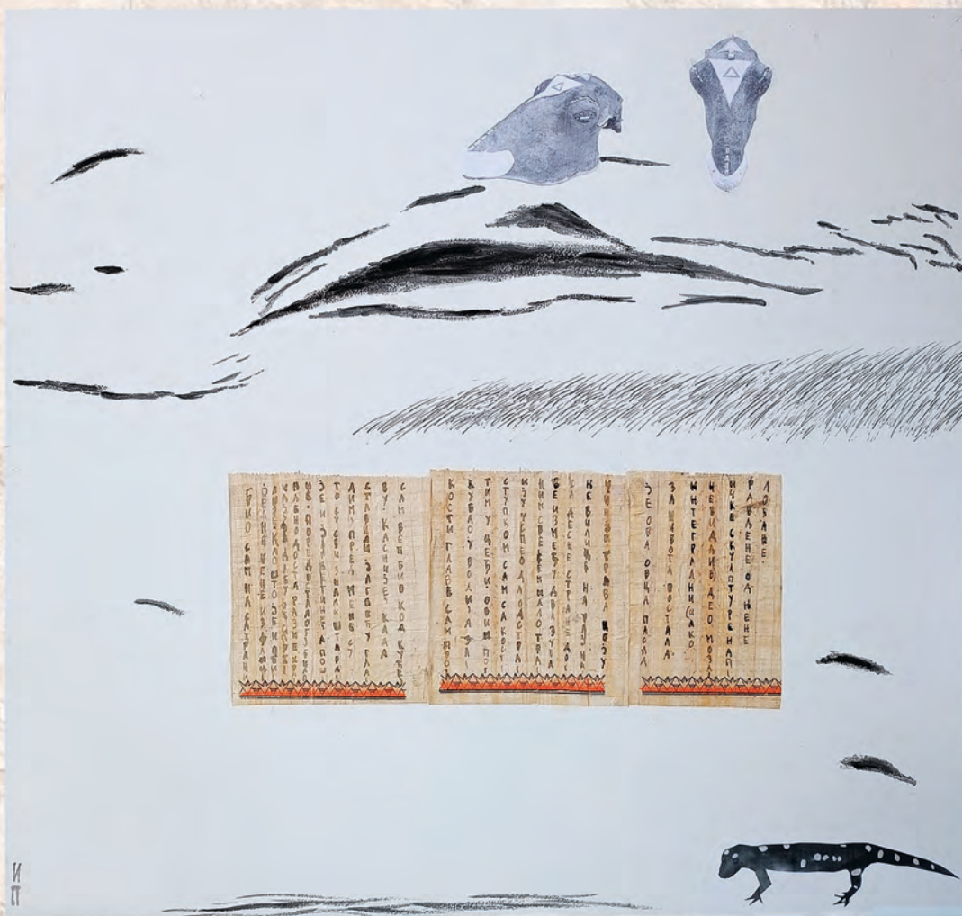
И П Травнато поле, 2024. колаж, 66x75cm И. Павић