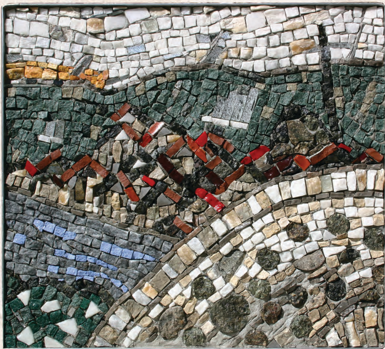
Призренски пејзаж 1, 2016. мозаик, 40,5x45cm