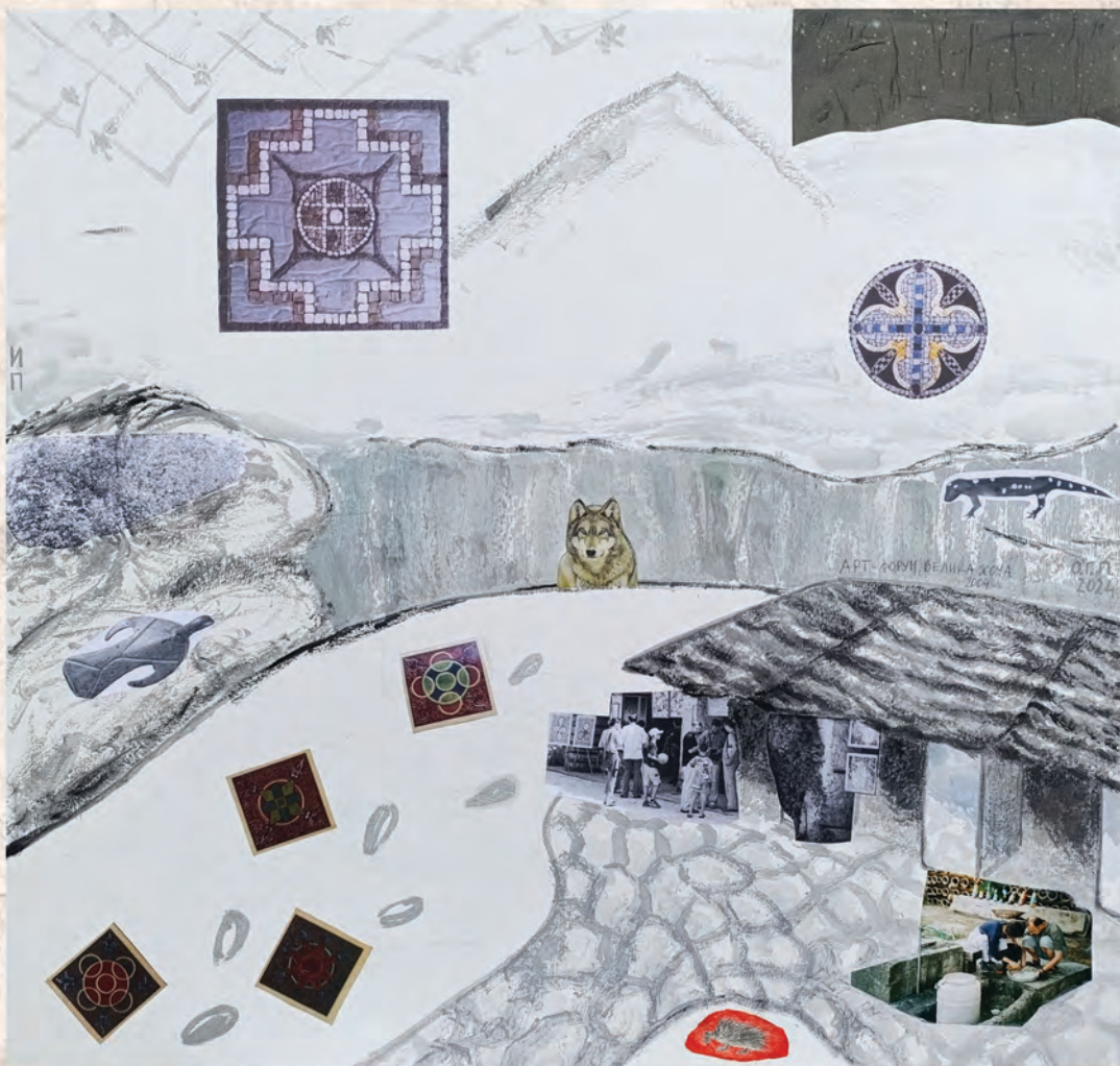
Арт Форум – Велика Хоча 2004, 2024. колаж, 66x75cm И.Павић и О.Г.Павић