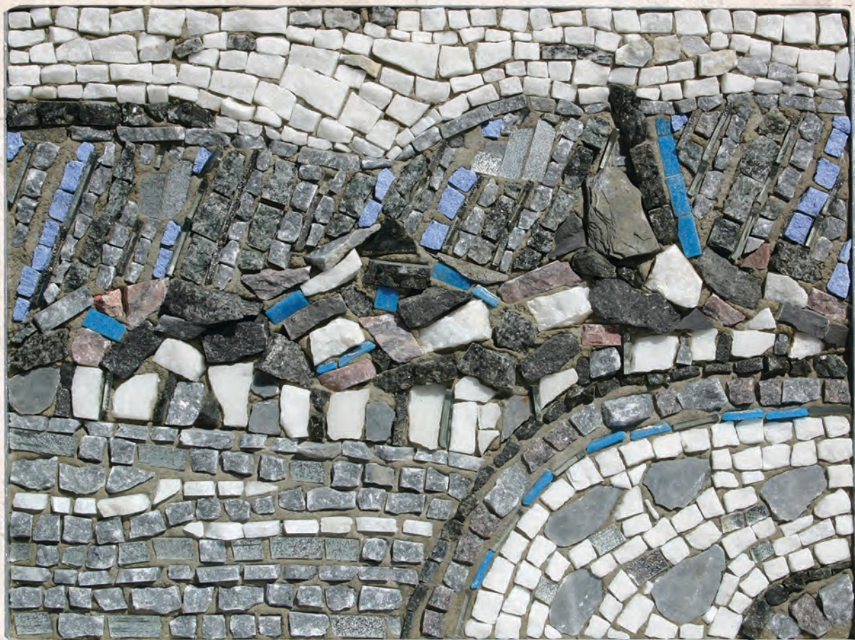
Призренски пејзаж 3, мозаик, 30.5x40cm, 2016.