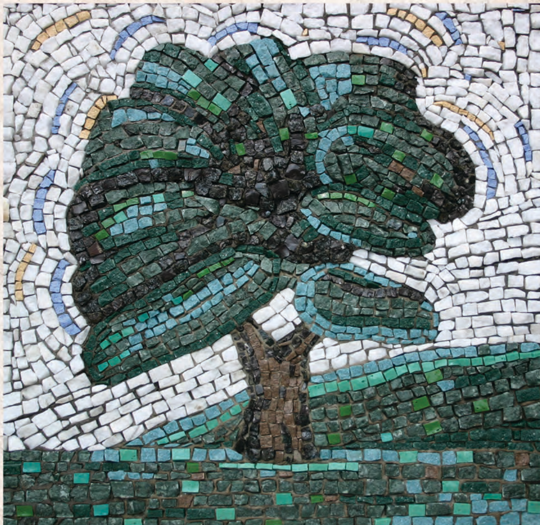
Дуб неземаљски, 2022. мозаик, 50x50cm И.Павић