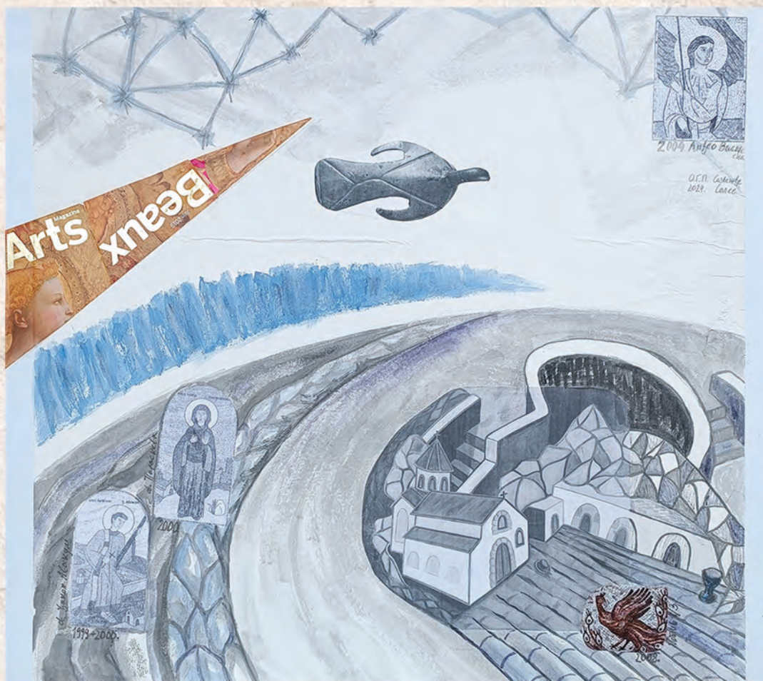
Сазвежђе Солее, 2024. колаж, 66x75cm О.Г.Павић