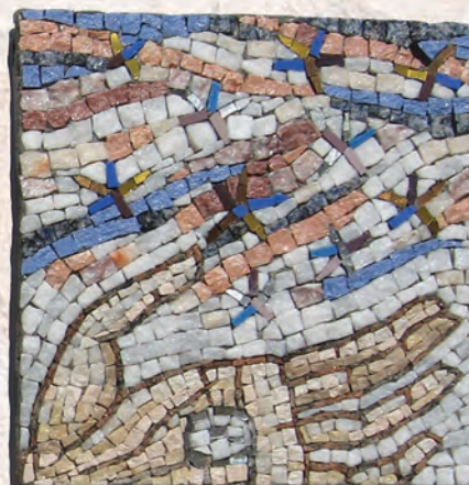
Три назначења 2010. мозаик, триптих, сваки 25x25cm О.Г. Павић