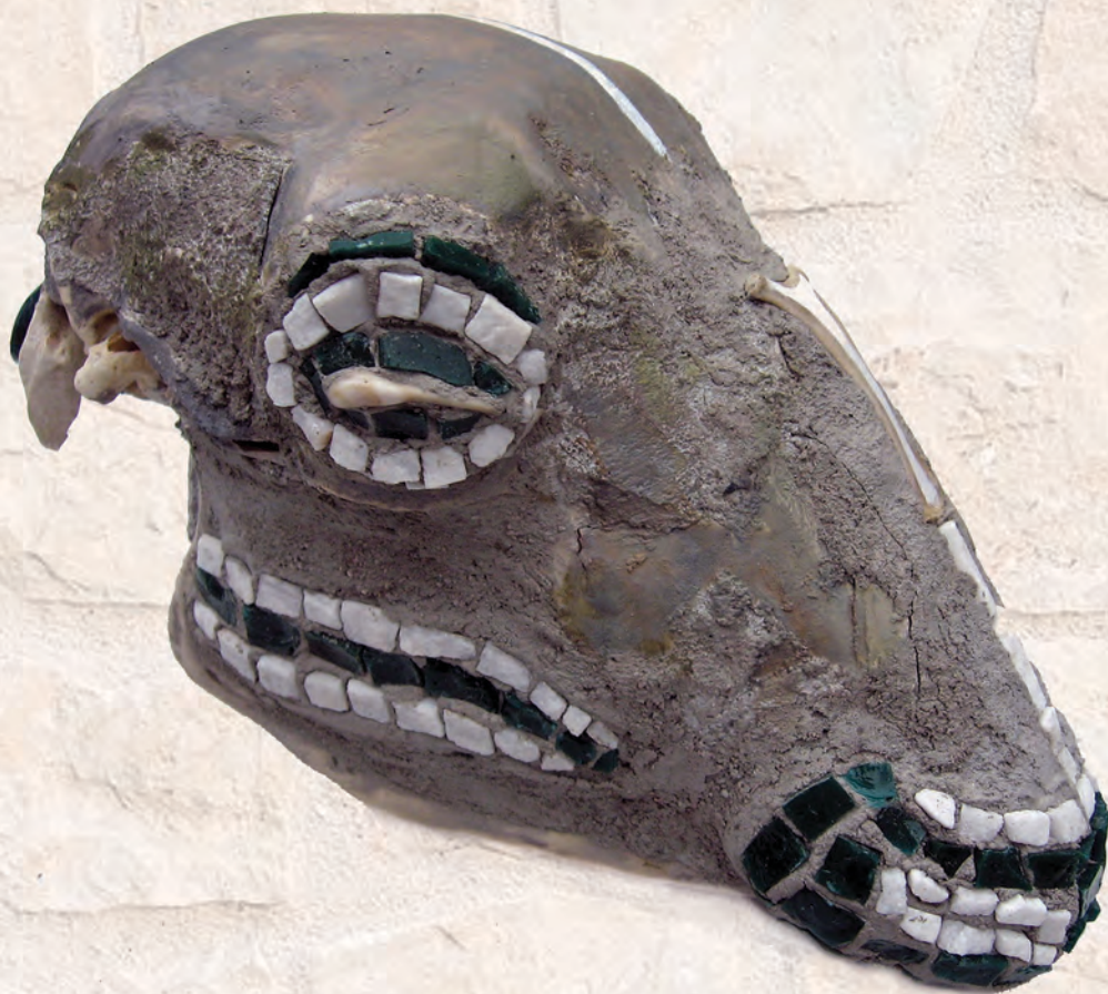
Сиви портрет, 2009. мозаик-објекат, 18x12x11cm И. Павић