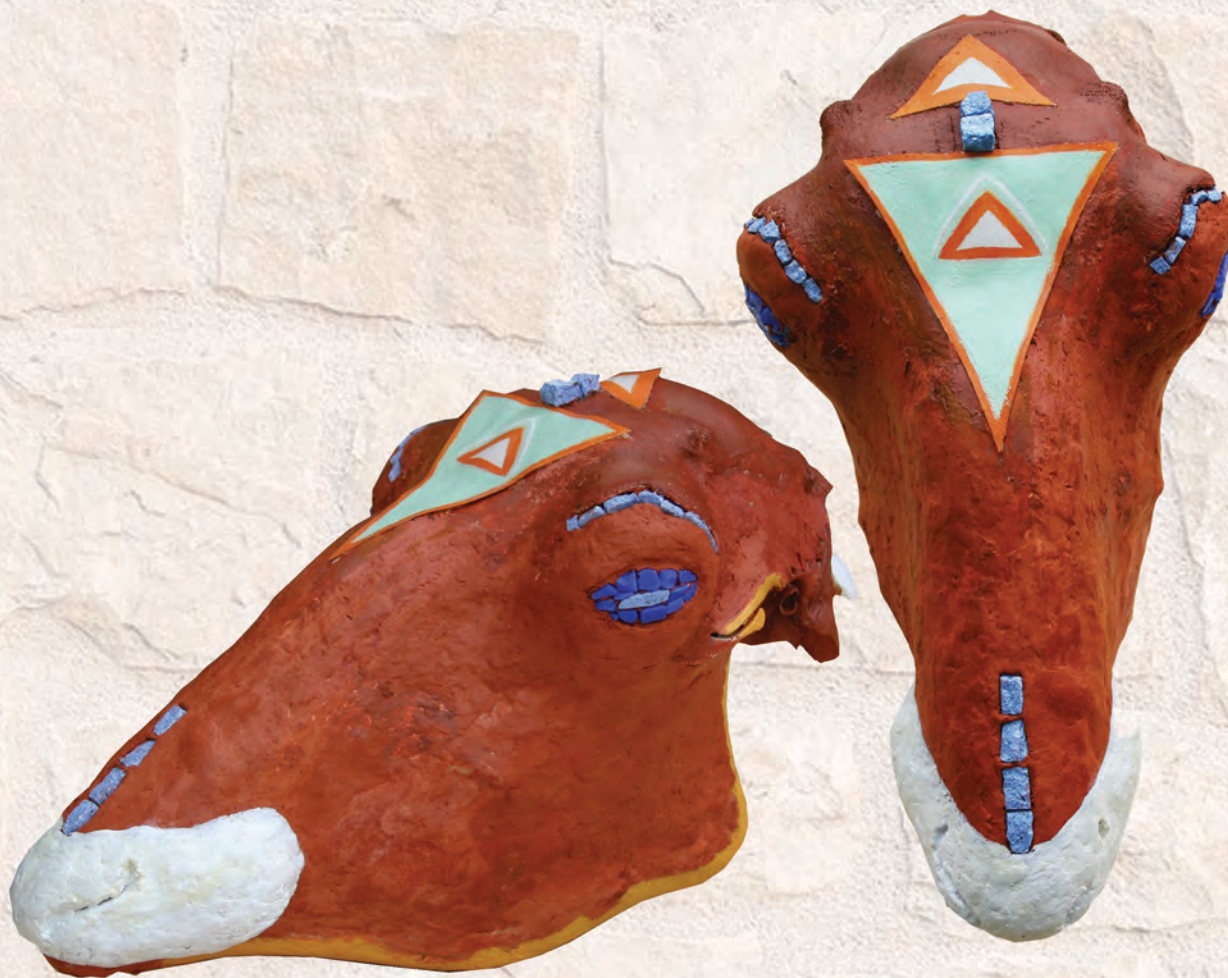
Полуживи портрет, 2019. мозаик-објекат, 24x13x12cm И. Павић