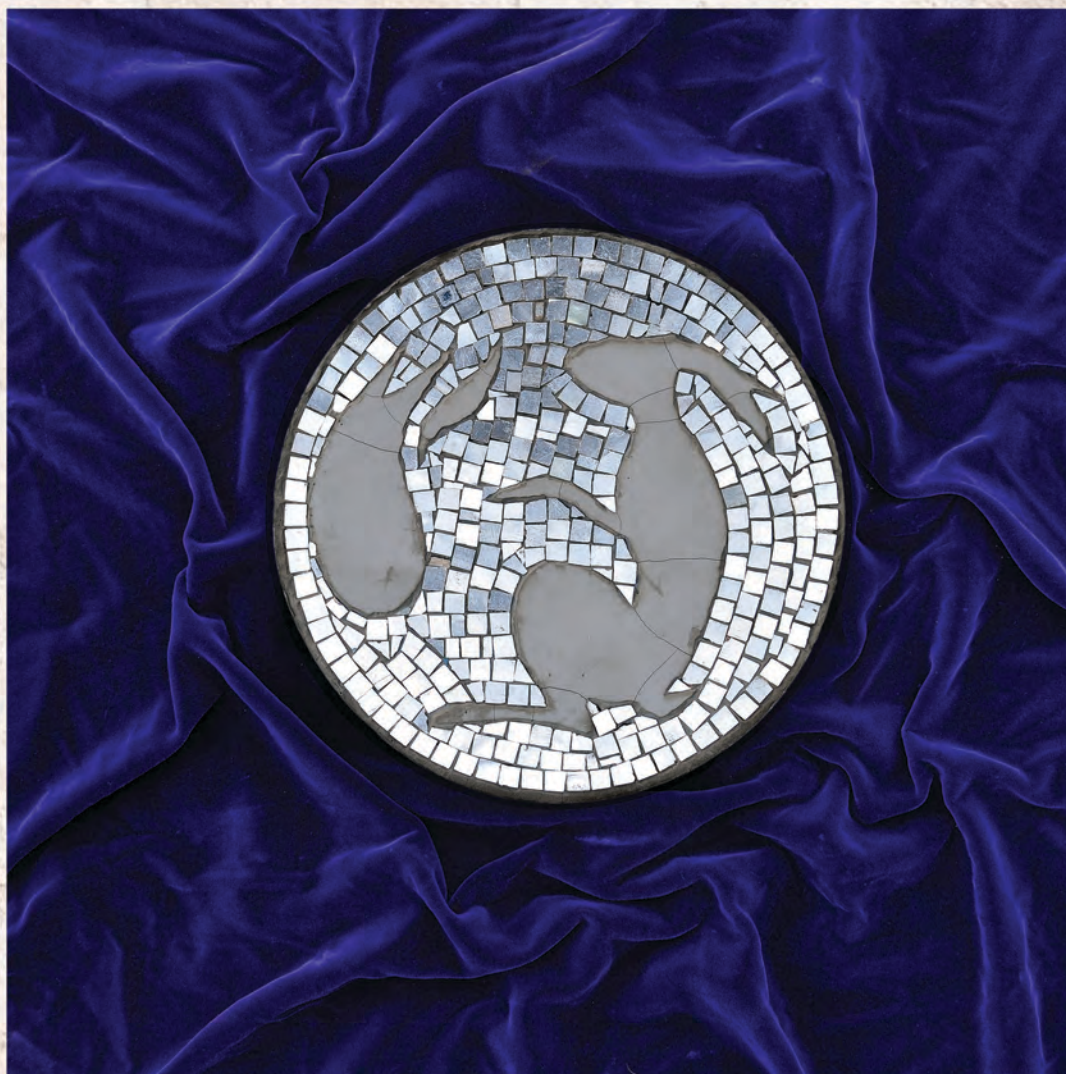
Месец-огледало, 2002. мозаик-асамблаж, ø 26cm И. Павић