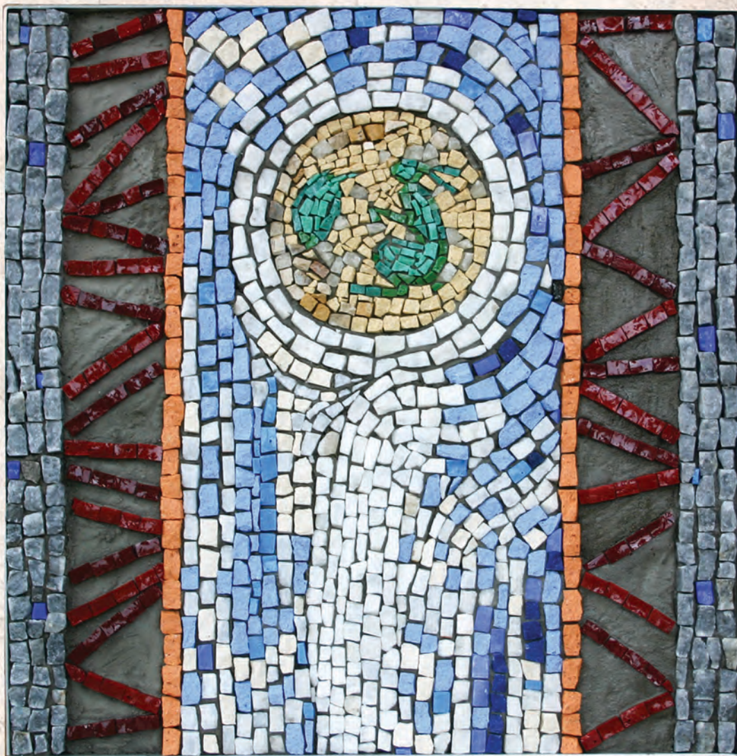
Зец од жада, 2024. мозаик, 50x50cm