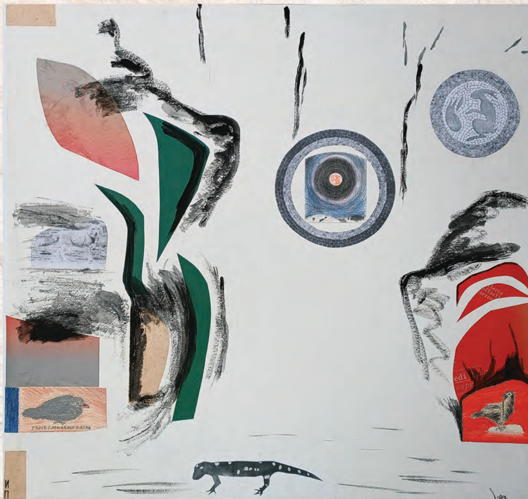
Месец и литице, 2024. колаж, 66x75cm И. Павић