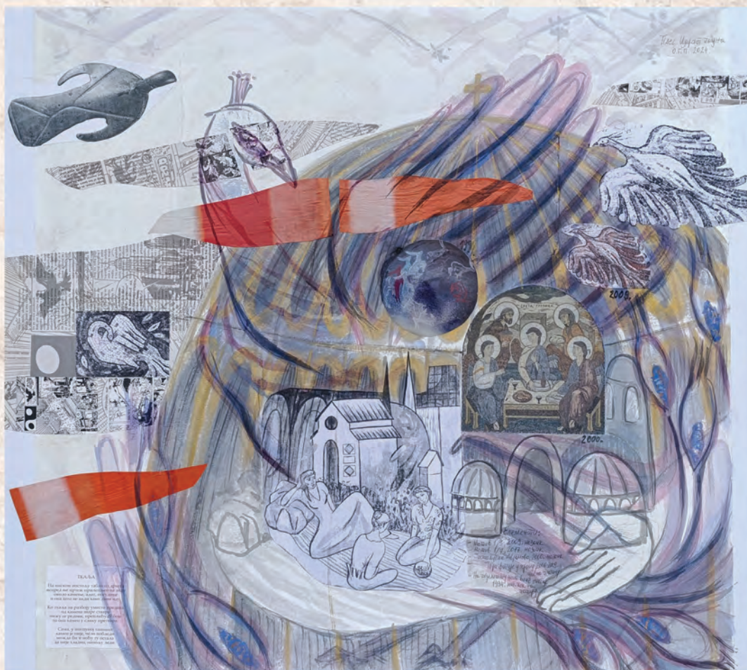
Плес Царског пауна, 2024. колаж, 66x75cm О.Г.Павић