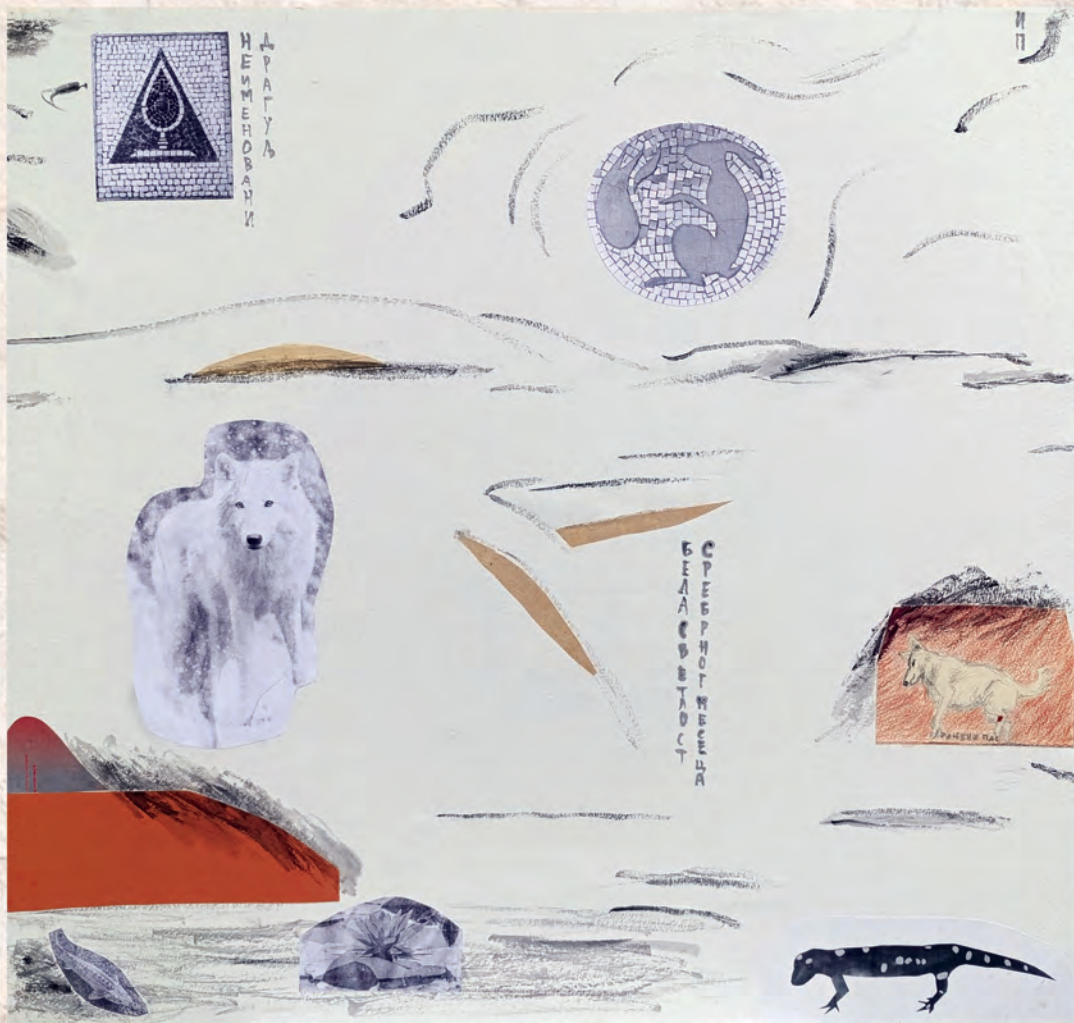
Светлост, 2024. колаж, 66x75cm И. Павић